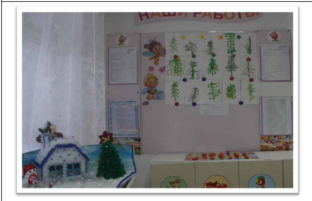
Старшая группа № 3 «Пчелки»