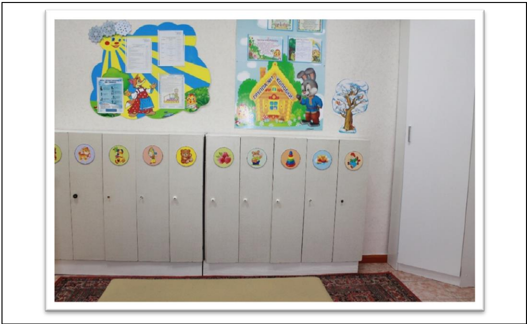
Младшая группа № 2 «Гномики»