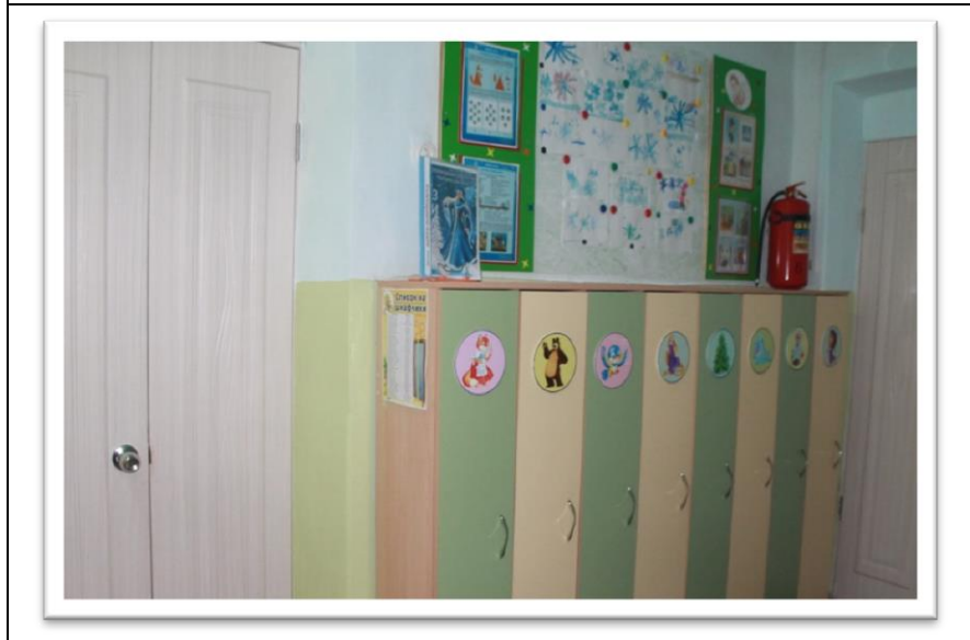
Подготовительная группа № 4 «Буратино»