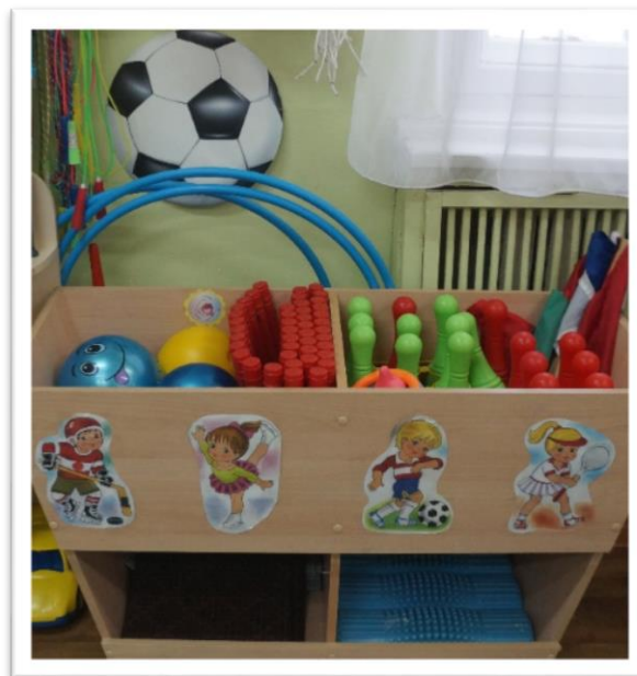
Физкультурный уголок в подготовительной группе №4 «Буратино»