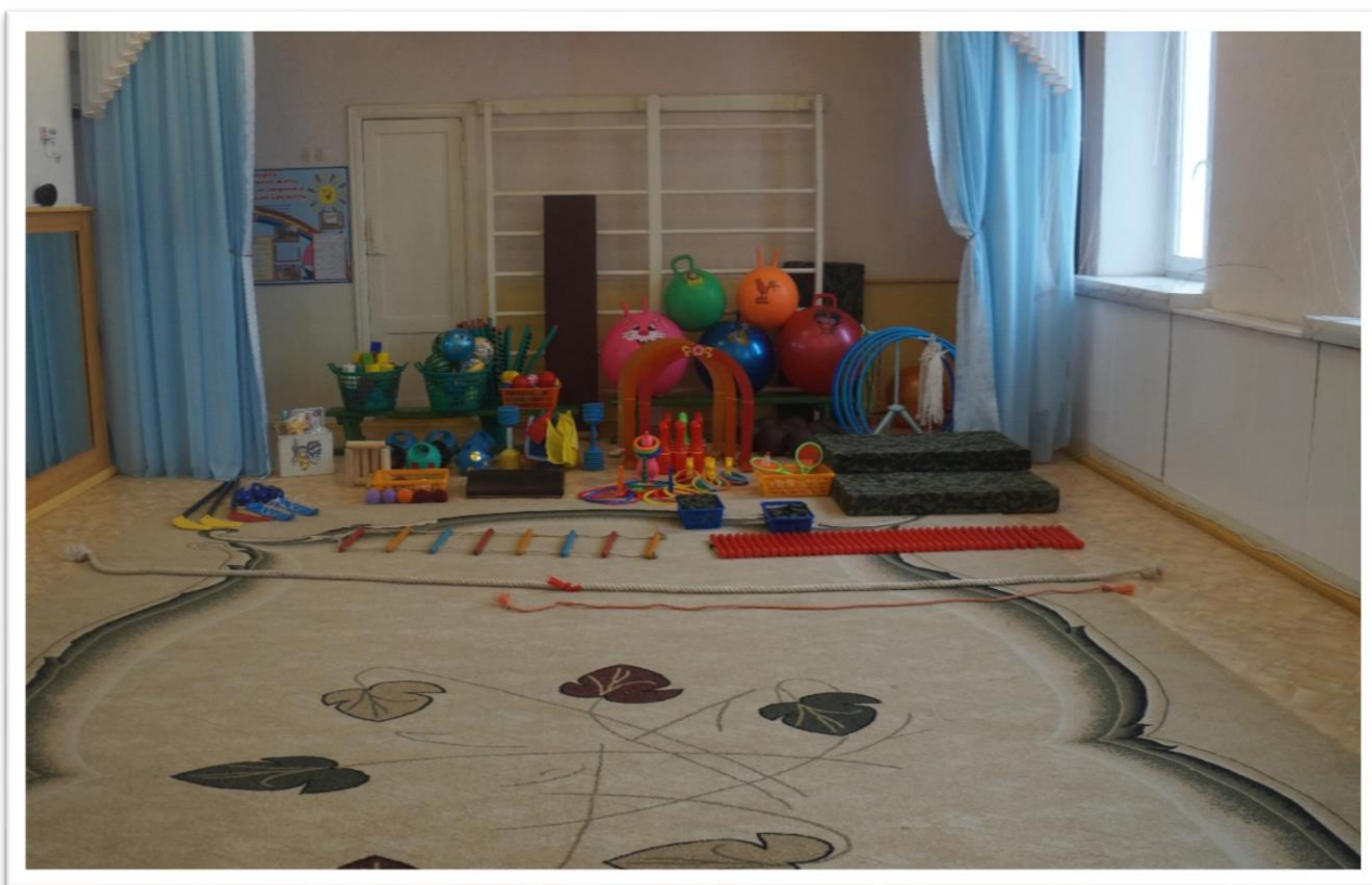
Перечень оборудования спортивного зала

Оборудование спортивного зала включает: оборудование для профилактики плоскостопия (массажные дорожки, массажные мячи), разнообразный спортивный инвентарь для физического развития детей разного возраста (мячи, обручи, гантели, флажки, ленты, скакалки, мешочки для метания и другое). Все оборудование соответствует санитарно - эпидемиологическими правилам и нормативам. Занятия по физической культуре развивают силу, скоростные качества, выносливость, что делает дошкольника подготовленным, активизирует его интерес к занятиям в различных секциях, в детских спортивных школах